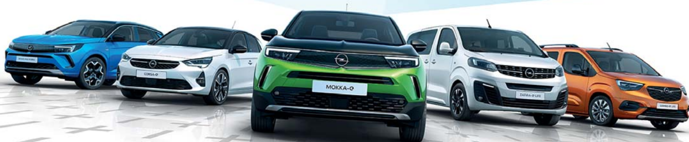
Abb. zeigen Sonderausstattungen.