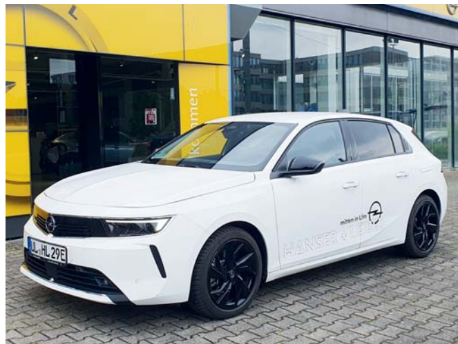
Abb. zeigen Sonderausstattungen.